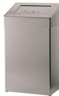
Art. nr.: 1110 / 1113