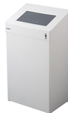
Art. nr.: 1111 / 1112